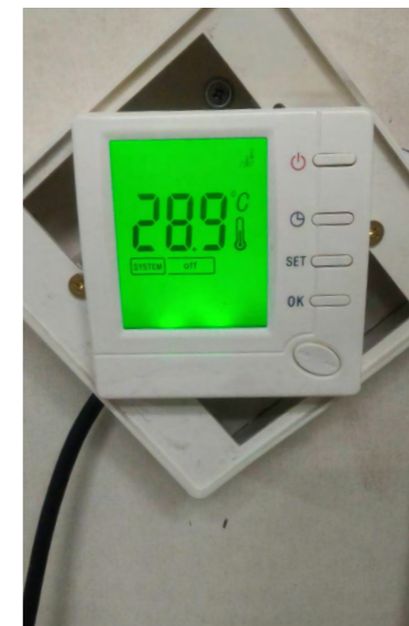
圖 3. 產品溫度測量