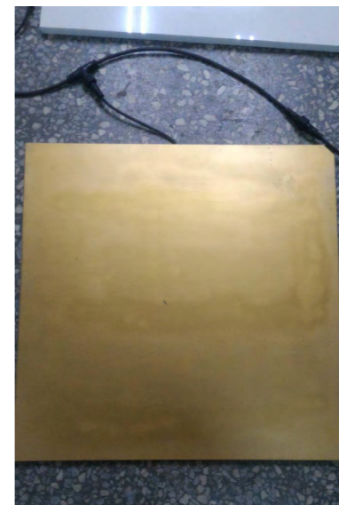
圖 2. 產品成果圖